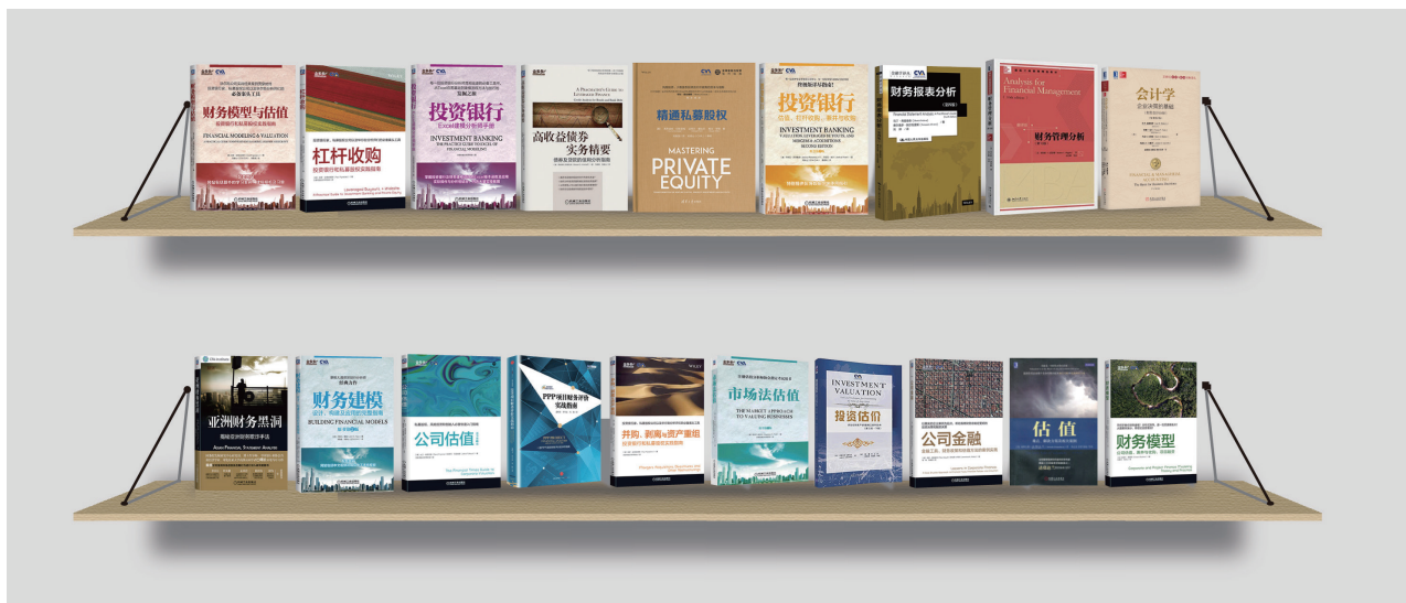
CVA®协会出版书籍展示